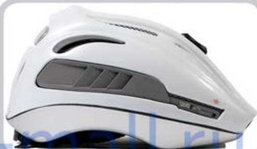
Веложелм со светодиодами

Наиболее полный перечень аксессуаров для безопасного движения представлен на сайте: https://elektro-mall.ru/