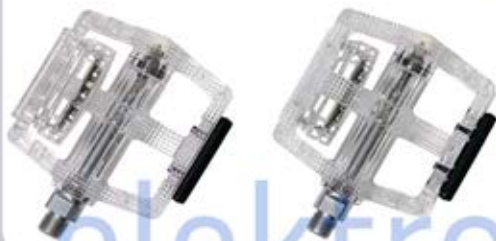
Педали со светодиодами