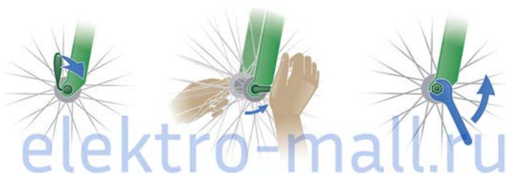
Эксцентриковый зажим колесных втулок